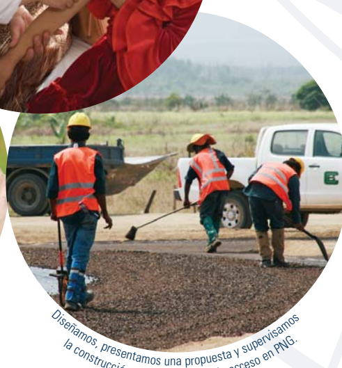
Diseñamos, presentamos una propuesta y supervisamos la construcción de una carretera de acceso en PNG.

Cardno está modelando el futuro mediante infraestructura física, económica y social. Más información en www.cardno.com