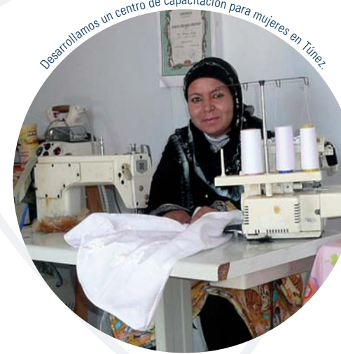
Desarrollamos un centro de capacitación para mujeres en Túnez.

Nuestro enfoque respecto de la sostenibilidad se basa en las asociaciones locales . Los socios locales de Cardno son miembros integrales del equipo. Empoderamos a los actores locales para que sean los arquitectos de su propio desarrollo y trabajamos para asegurarnos de que los dividendos del desarrollo se distribuyan ampliamente. Por ejemplo, Cardno recurrió a los expertos locales en Ucrania para establecer un Centro de Derecho Comercial financiado por USAID para permitir al sector privado prosperar en una economía de mercado. El Centro se volvió autosuficiente en el transcurso del proyecto y en la actualidad continúa desarrollando la infraestructura jurídica de Ucrania.