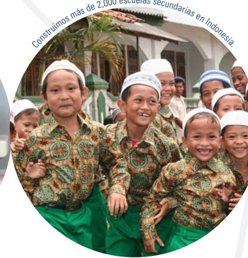
Construimos más de 2,000 escuelas secundarias en Indonesia.