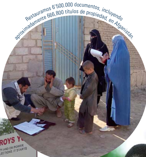
Restauramos 6'500,000 documentos, incluyendo aproximadamente 666,800 títulos de propiedad, en Afganistán.

Cardno trabaja con partes interesadas claves para diseñar e implementar estrategias de desarrollo social en temas que van desde la seguridad alimentaria y educación hasta el cambio climático y la salud. Por ejemplo, Cardno diseñó un programa de €95 millones en Malawi para aumentar la producción agrícola y mejorar la seguridad alimentaria. En Indonesia, Cardno está vinculando a los ministerios del Gobierno con el sector privado para desarrollar planes de estudio y capacitar a profesores en 2,000 escuelas secundarias en 240 distritos. En Uganda, Cardno está trabajando con empresas del sector privado para ampliar los servicios de salud que ofrecen a sus empleados, dependientes, y miembros de la comunidad inmediata. Este proyecto financiado por la USAID, ha llegado a más de 350,000 personas hasta la fecha. Cardno fortalece la infraestructura social de las comunidades para dotar a los actores locales con las herramientas que necesitan para lograr un futuro saludable y sostenible.