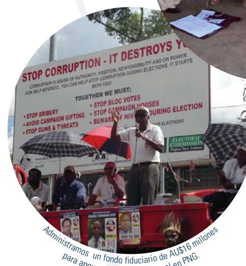
Administramos un fondo fiduciario de AUS$16 millones para apoyar la reforma electoral en PNG.