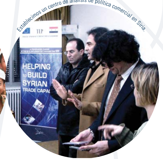
Establecimos un centro de análisis de política comercial en Siria.